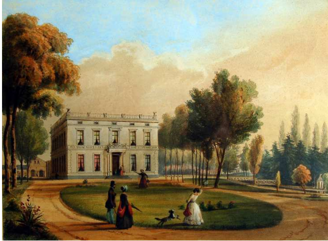
▲ Bronbeek midden jaren 1840. Litho C.A. Spin. Uitgeverij F.Buffa

Met de komst van Carel Verkouteren breekt een belangrijke fase aan, want hij laat het huis in 1842 3 herbouwen, waarschijnlijk op de fundamenteën van het oude huis. De vroegste, ons bekende afbeelding van het nieuwe huis van Verkouteren is een steendruk uit het midden der jaren 1840 (afb. 2). Daaruit blijkt dat we in geen geval meer te maken hebben met "een bescheiden wit huisje", zoals Markus het beschreef. We zien een villa in de dan moderne neoclassicistische stijl: een bepleisterd, blokvormig pand van twee verdiepingen met een streng symmetrische gevelopbouw.