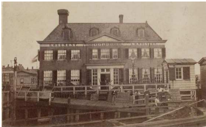
▲ De Nieuwe Stadsherberg te Amsterdam, ca 1865.